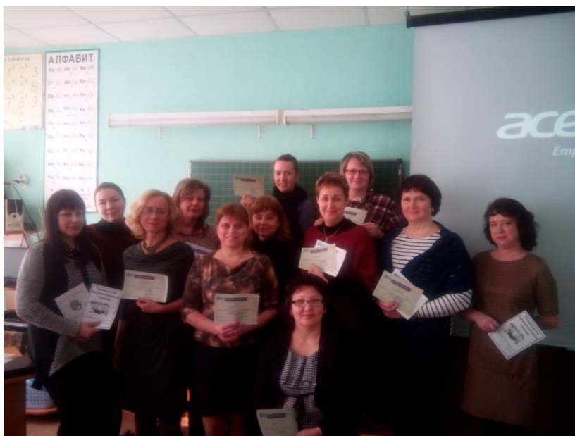
После вручения сертификатов.